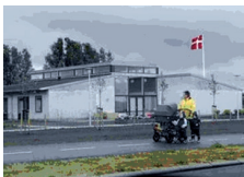
Boformen Nordstjernen fra indvielsen juni 2008.

Rammeaftalen omfatter alle tilbud, der er omfattet af den regionale forsyningsforpligtigelse, som er i servicelovens § 5 samt almenboliglovens § 185 b, stk. 1, uanset om en kommune, regionen eller en privat udbyder driver tilbuddet. I det omfang kommuner overtager driften af tilbud fra regionen, overgår forsyningsforpligtigelsen således tilsvarende til kommunen.